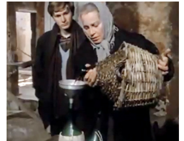
1976 L'AGNESE VA A MORIRE de Giuliano Montaldo avec Rosalino Cellamare