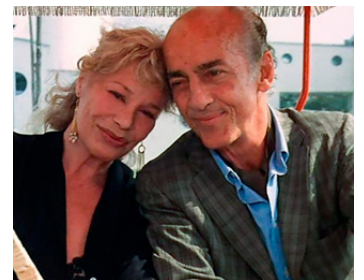
1988 LA MAISON DU SOURIRE (La Casa del Sorriso) de Marco Ferreri avec Dudo Ruspoli