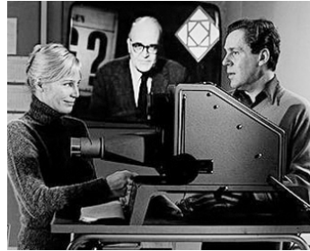
1973 MONISMANIEN 1995 (Monismanien 1995) de Kenne Fant avec Gösta Cederlund