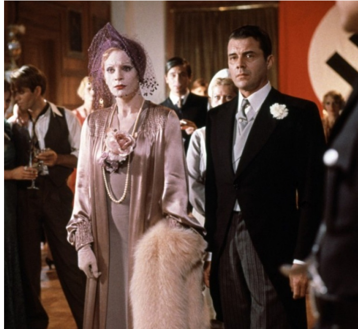
1970 LES DAMNÉS (La Caduta degli Dei) de Luchino Visconti avec Dirk Bogarde