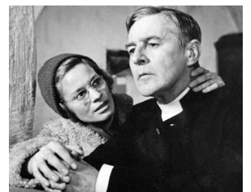
1962 LES COMMUNIANTS (Nattvardsgästerna) d'Ingmar Bergman avec Gunnar Björnstrand