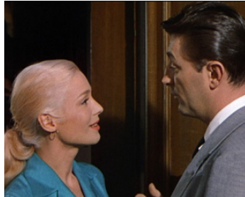
1956 L'ÉNIGMATIQUE MONSIEUR D (Foreign Intrigue) de Sheldon Reynolds avec R. Mitchum