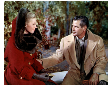
1961 LES 4 CAVALIERS DE L'APOCALYPSE de Vincente Minnelli avec Glenn Ford