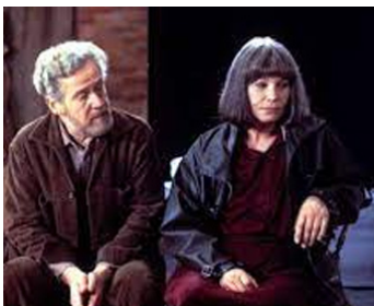
1984 APRÈS LA RÉPÉTITION (Eifter repetitionen) d'Ingmar Bergman avec Erland Josephson