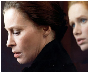
1972 CRIS ET CHUCHOTEMENTS (Viskningar och rop) d'Ingmar Bergman avec Liv Ullmann