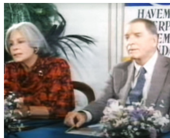
1986 CONTRÔLE (Il Giorno prima) de Giuliano Montaldo avec Burt Lancaster