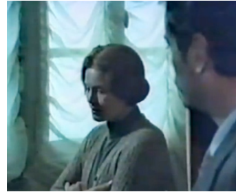
1974 E COMINCIO IL VIAGGIO NELLA VERTIGINE de Toni De Gregorio