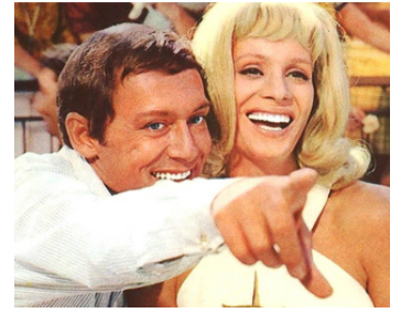
1967 LE DIABLE SOUS L'OREILLER (Un Diabolo bajo la almohada) de J. M. Forqué avec M. Ronet