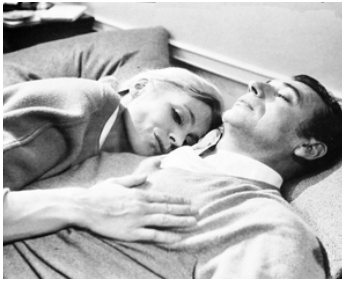
1965 LA GUERRE EST FINIE d'Alain Resnais avec Yves Montand