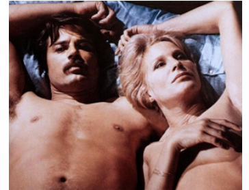
1971 JE SUIS VIVANT! (Malastrana) d'Aldo Lado avec Jean Sorel