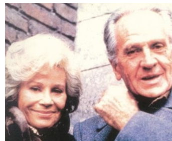
1987 LE CŒUR DE MAMMA (Il Cuore di Mamma) de Gioia Benelli avec Massimo Girotti