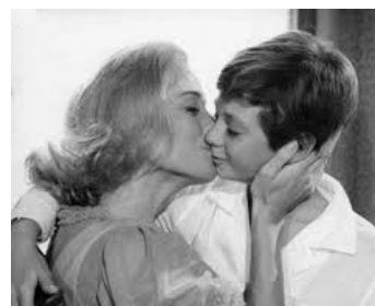
1962 AGOSTINO (La Perdita dell'Innocenza) de Mauro Bolognini avec Paolo Colombo