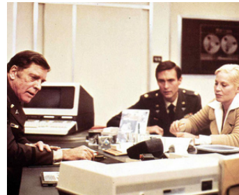
1976 LE PONT DE CASSANDRA de G. Pan Cosmatos avec B. Lancaster, J. Ph. Law