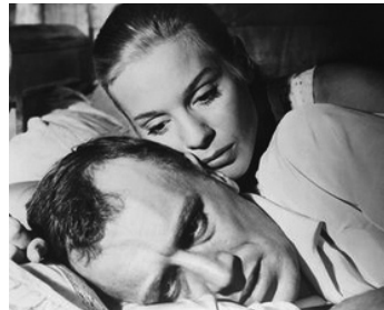
1959 LE VISAGE (Ansiktet) d'Ingmar Bergman avec Max von Sydow