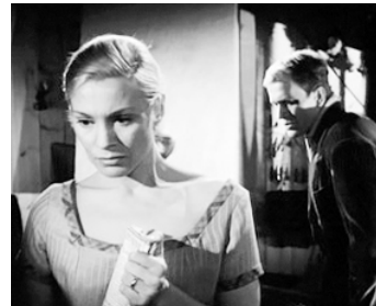
1960 LE JUGE (Domaren) d'Alf Sjöberg avec Gunnar Hellström