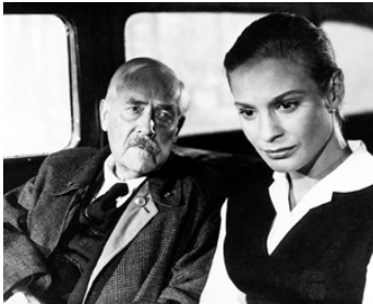
1958 LES FRAISES SAUVAGES (Smultronstället) d'Ingmar Bergman avec Victor Sjöström