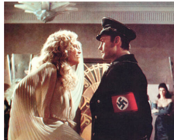
1975 SALON KITTY (Doppelspiel) de Tinto Brass avec Helmut Berger