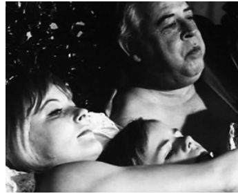
1966 JEUX DE NUIT (Nattlek) de Mai Zetterling avec Keve Hjelm