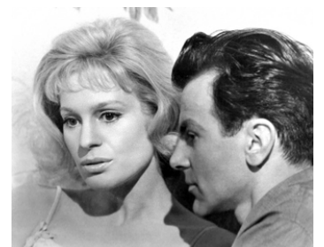
1965 LE DÉMON EST MAUVAIS JOUEUR (Return from the Ashes) de J. Lee Thompson avec Mx Schell