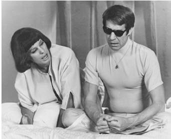
1969 LE RITE (Riten) d'Ingmar Bergman avec Anders Ek