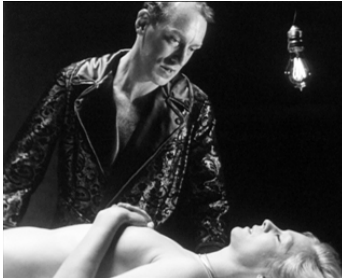
1967 L'HEURE DU LOUP (Vargtimmen) d'Ingmar Bergman avec Max von Sydow