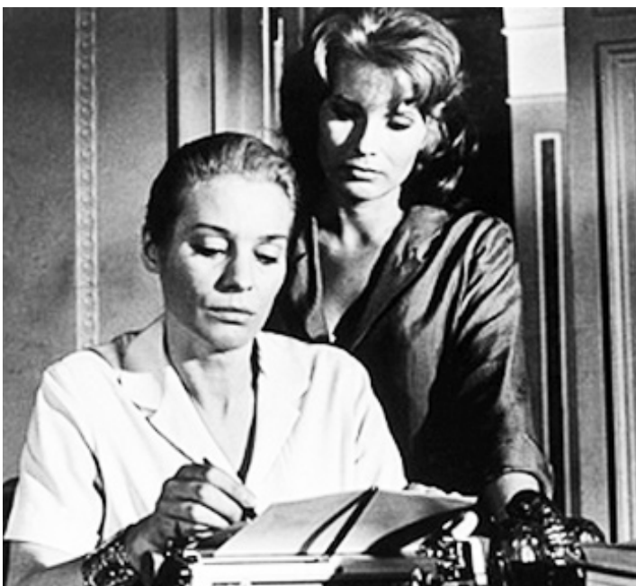
1963 LE SILENCE (Tystnaden) d'Ingmar Bergman avec Gunnel Lindblom