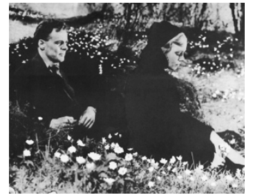
1950 QUAND L'AMOUR ARRIVE AU VILLAGE d'Arne Mattsson avec Sven Lindberg