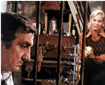
1975 LA CAGE de Pierre Granier-Deferre avec Lino Ventura