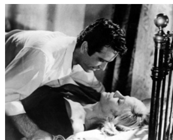
1964 UN CERTAIN DÉSIR (Die Lady) d'Hans Albin avec Paul Hubschmid